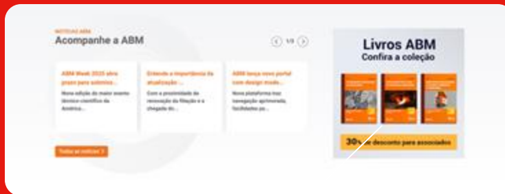
Banner Vertical 2