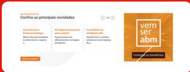
Banner Vertical 1