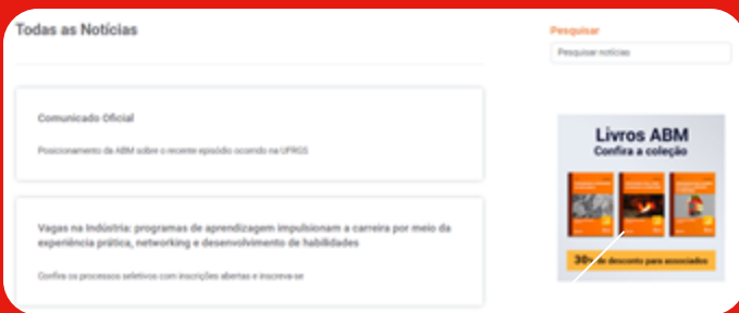
Banner Vertical 1 (Notícias do Setor)