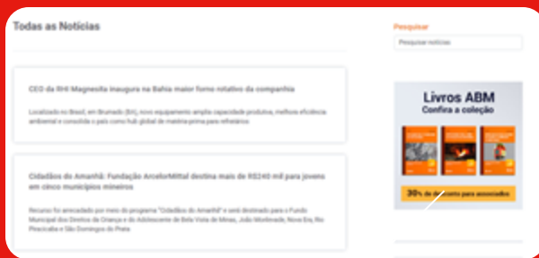
Banner Vertical 2 (Notícias do Setor)

Dimensões recomendadas Vertical (desktop) - 412x412 Vertical (mobile) - 315x315